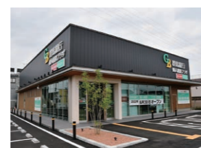
個人相談プラザ伊勢崎