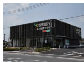
個人相談プラザ前橋