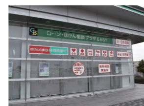
個人相談プラザ EAST (大泉支店内)