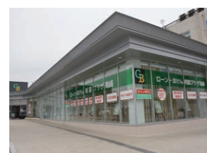
個人相談プラザ高崎 (高崎田町支店内) (2022年12月移転予定)