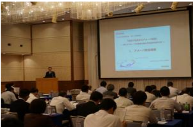
○ 第10回勉強会 H26.7.7