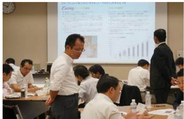
○ 第2期経営塾 H26年4月~10月