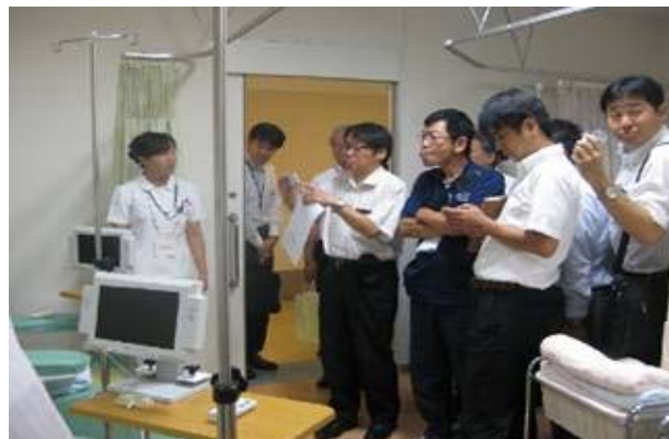
○「医療施設」現場見学会 H26.9.12