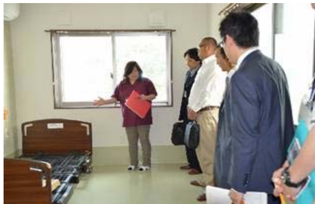
○「介護施設」現場見学会 H26.5.22