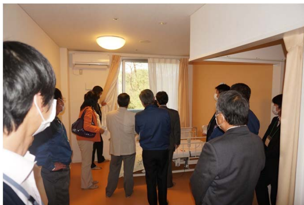
○「介護施設」現場見学会H26.11.14 (富岡市)