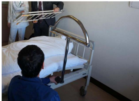
○「医療施設」における試作品テスト (金属プレス加工業者による転倒防止補助具の提案)