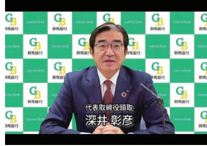
個人投資家向け会社説明会 (オンライン、2023 年 2 月実施)